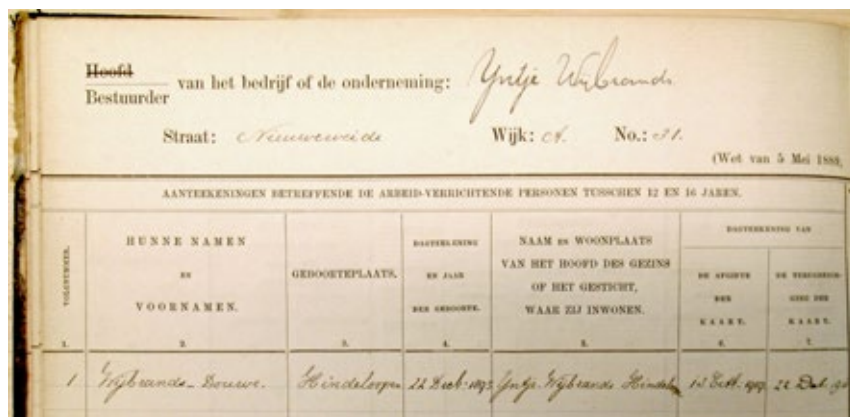
Scheepstimmerman Yntje Wybrands met zijn zoon Douwe, 14 jaar oud, als 'arbeid-verrichtend persoon' in het patentregister van 1909

opgaf. Nu zijn de meetmethodes ook verschillend, maar minder ton is wel minder patentbelasting.